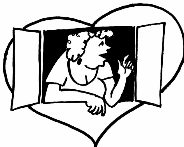
Promluvit ze srdce někomu – vyslovit jeho myšlenku, názor apod.