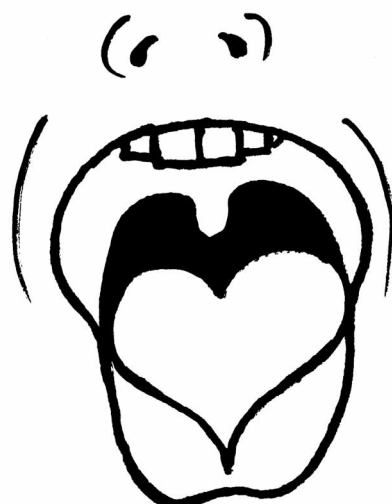
Mít srdce na jazyku – být upřímný, přímý