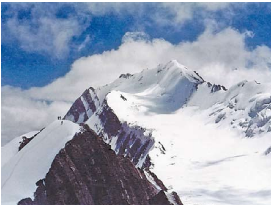
Obr. 3. Tarka 5 368 m.

již při vysokém normálním krevním tlaku a zda je cílovou hodnotou 130 mmHg a méně. Obě tvrzení jsou pouze spekulativní a zatím nemají podklad ve velké klinické studii.