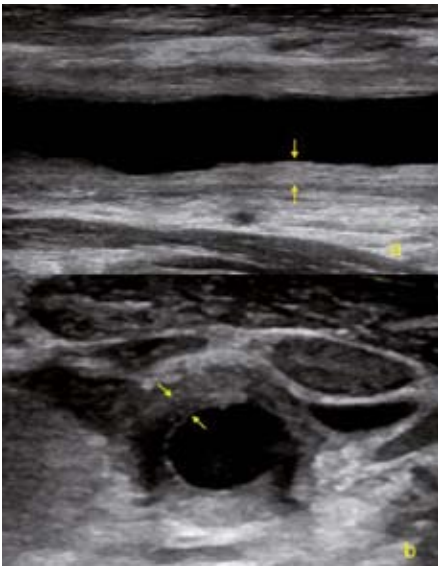
Obr. 1. USG obrázek difúzního zesílení cévní stěny společné karotidy v akutní fázi Takayasu arteritidy. a – podélná projekce, b – příčná projekce.