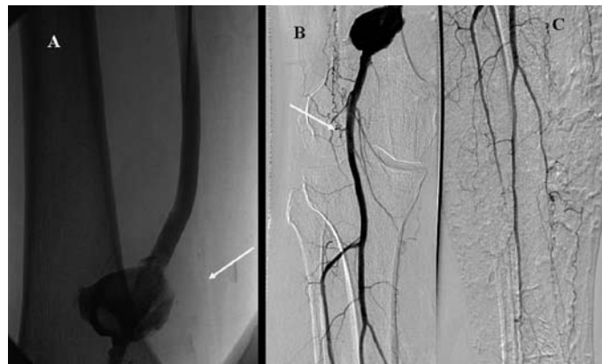
Obr. 3. Kontrolní angiografie po 24 hod trombolýzy prokazuje průchodný bypass (panel A) a velké pseudoaneuryzma v místě minulé implantaci stentu (panel B) a dobře průchodné bérčové tepny (panel C).