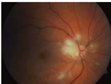
Obr. 3. Oční pozadí – týž pacient. Po 12 hod od podání systémové trombolytické terapie. Pacient počítá prsty před okem.