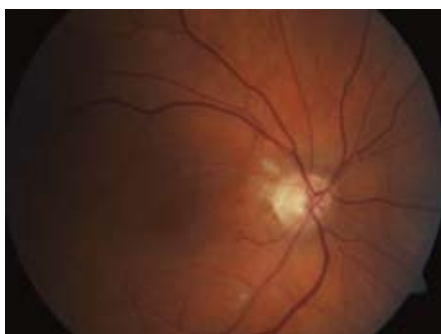
Obr. 4. Oční pozadí – týž pacient. Za jeden měsíc od podání systémové trombolytické terapie, vstřebání vatovitých exsudátů, téměř úplná úprava zrakové ostrosti.

ment Group for Lysis in The Eye Study). Jde zatím o jedinou prospektivní randomizovanou multicentrickou studii. Studie byla pečlivě připravena tak, aby přinesla jednoznačné výsledky a co nejvíce odpovídala reálné praxi. Nepřinesla však zdaleka takové výsledky, jaké odborná veřejnost očekávala. Původně měla probíhat v 16 centrech ve Švýcarsku, Německu a Rakousku, kde jsou s fibrinolytickou léčbou největší zkušenosti. Nábor začal v září roku 2002 a ukončení bylo v plánu v roce 2006. Autoři chtěli do každé z větví randomizovat po 200 pacientech, nicméně v dubnu roku 2005 bylo randomizováno jen 47 nemocných. Okno pro podání trombolytika bylo 20 hod a zraková ostrost před zahájením konzervativní nebo endovaskulární léčby musela být < 0,5 . Používaným fibrinolytikem byla altepláza. Primárním cílem bylo zhodnocení vizu až po jednom měsíci, protože z klinického pozorování je známo, že první efekt trombolytické léčby je sice patrný již po prvních 12 hod, kdy se obnovuje perfuze postiženou tepnou, nicméně ke zlepšování vizu dochází ještě v průběhu prvního měsíce, kdy regreduje edém papily zrakového nervu [12]. Druhotným cílem bylo porovnání bezpečnosti obou metod.