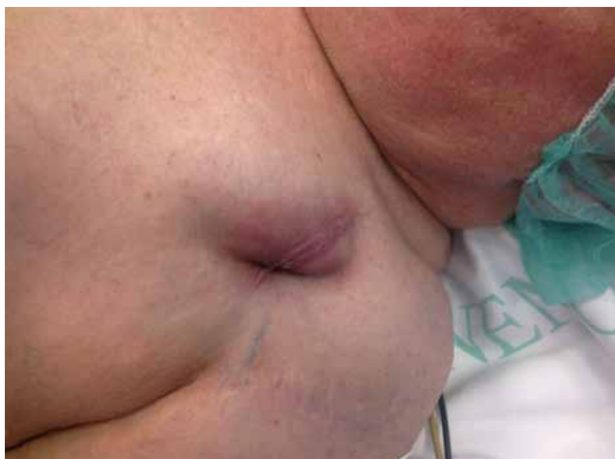
Obr. 3. Lokální zánět v kapse kardiostimulátoru.

Trvalá kardiostimulace patří dnes již k rutinním výkonům a jako každý invazivní výkon má své komplikace, s kterými musíme počítat, naučit se je včas rozpoznávat a řešit. Nejzávažnější komplikace vznikají během prvních tří měsíců od implantace. Při každém podezření na symptomy související se stimulačním systémem je nutné pacienta odeslat na specializované pracoviště, kde byl tento systém pacientovi implantován.