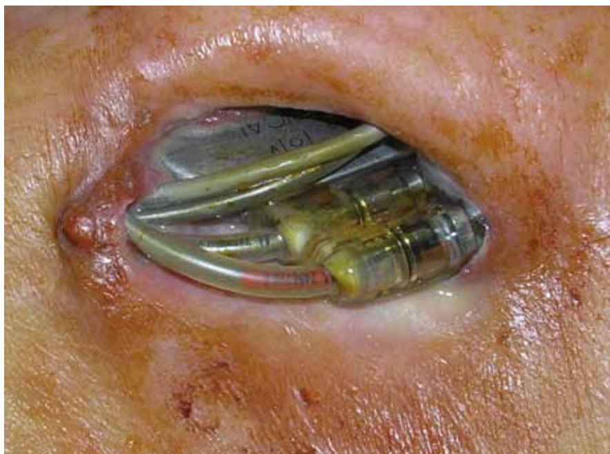
Obr. 2. Dekubitus v kapse kardiostimulátoru s protrusí elektrod a přístroje.

Incidence infekce elektrod aktivních implantátů je v literatuře udávána velmi variabilně od 0,13 % do 19,9 %. Tento rozptyl může být