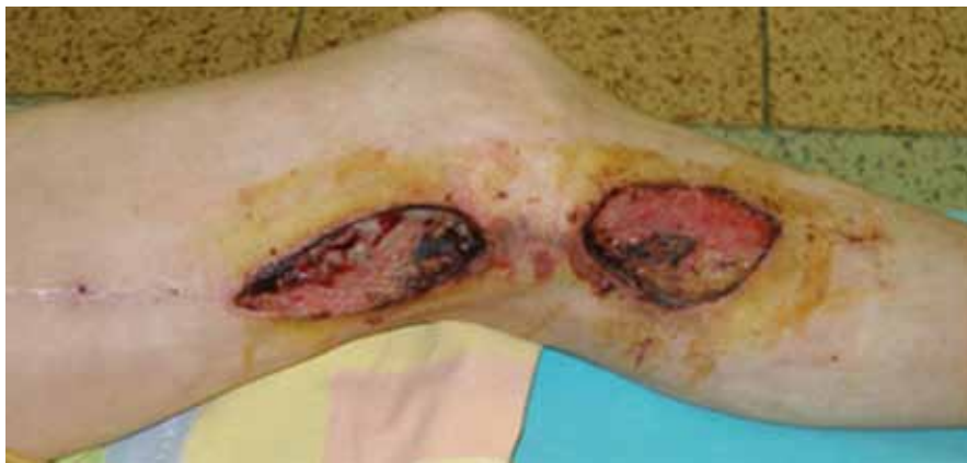
Obr. 1. Infekcia a dehiscencia operačných rán 1 mesiac po implantácii femoro-popliteálneho distálneho bypasu s autológnu reverznou vena saphena magna na ľavej dolnej končatine. Obnažený priechodný bypas v operačnej rane nad kolenom.

uskutočnených u 209 pacientov s vekom nad 70 rokov (tab. 1, 2).