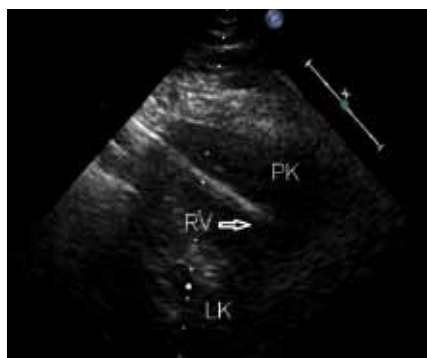
Obr. 1. Transthorakální echokardiografie – modifikovaná parasternální projekce – vzhledem k špatné vyšetřitelnosti a artefaktům z elektrody málo výtěžná (PK – pravá komora, LK – levá komora, RV – defibrilační elektroda).

Problematika perforace pravé srdeční komory defibrilační elektrodou představuje velmi aktuální problém s ohledem na narůstající populaci nositelů implantabilních kardioverterů-defibrilátorů. V literatuře je často zmiňována doba manifestace od zavedení defibrilačního systému, a i když perforace v akutním poim-