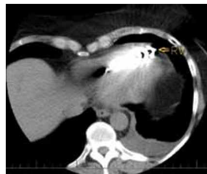
Obr. 2. CT vyšetření hrudníku – hrot defibrilační elektrody pravděpodobně zasahuje mimo srdeční konturu, nelze však jednoznačně odlišit případnou perforaci myokardu od artefaktů způsobených elektrodou (RV – defibrilační elektroda).

Pacientka byla přeložena na kardiologické pracoviště k extrakci defibrilační elektrody za kontroly jícnovou echokardiografií. Výkon proběhl bez komplikací, dle kontrolního echokardiografického vyšetření přetrvával jen drobný perikardiální výpotek – šlo však o stacionární nález. Následně s odstupem dvou týdnů byla pacientce zavedena nová defibrilační elektroda s umístěním do spodního septa pravé komory (Durata 7F 7120Q/65 cm, St. Jude Medical, Inc., Minnesota, USA) a byl připojen původní defibrilátor. Parametry citlivosti a stimulace změ-