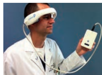
Obr. 6. CLOBUST-ER (Cerevast Therapeutics).

ných sonografistů. Jednou z možností, jak sonotrombolýzu uvést do běžné praxe, je vytvoření automatických přístrojů, které nevyžadují přítomnost zkušeného operátora. Pilotní studií s přístrojem CLOBUST-ER firmy Cerevast (obr. 6) byla studie CLOBUST-HF . Do studie bylo zařazeno 20 pacientů s proximální intrakraniální okluzí (70 % ACM, medián NIHSS 15). Všichni pacienti tolerovali dvouhodinovou insonaci přístrojem a u žádného nedošlo k rozvoji IC krvácení. Po 2 hod bylo plné rekanalizace dosaženo u osmi pacientů (40 %) a u dvou pacientů (10 %) došlo k rekanalizaci parciální. Tyto výsledky jsou velmi povzbudivé, je dosaženo minimálně dvojnásobné rekanalizace oproti sa-