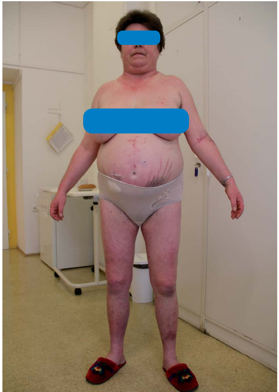
Obr. 1. Vzhled pacientky s Cushingovým syndromem.

Vyskytuje se až u 75 % pacientů s CS a CS patří mezi základní typy sekundární hypertenze s často typickými znaky, jako je rychlý rozvoj, tíže hypertenze, rezistence na léčbu, vymizení cirkadiálního rytmu TK, u vysoce aktivních případů rovněž hypokalemie. Patogeneticky se na rozvoji arteriální hypertenze u CS podílí řada faktorů [13]. Nadbytek volného kortizolu