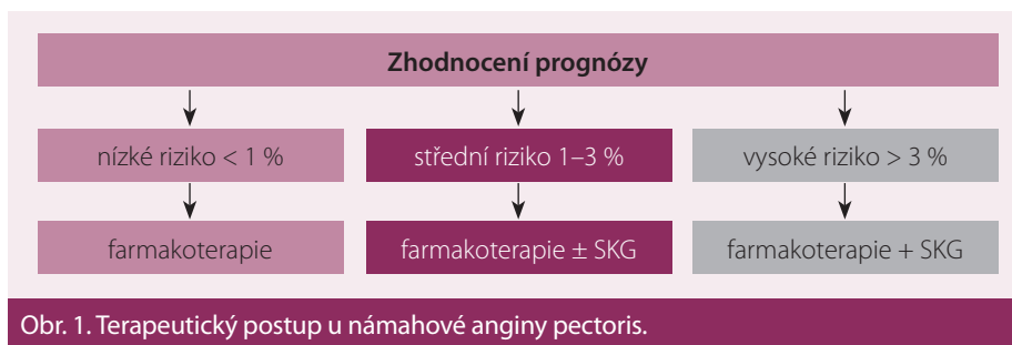
Obr. 1. Terapeutický postup u námahové anginy pectoris.