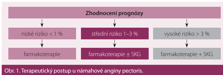
Obr. 1. Terapeutický postup u námahové anginy pectoris.