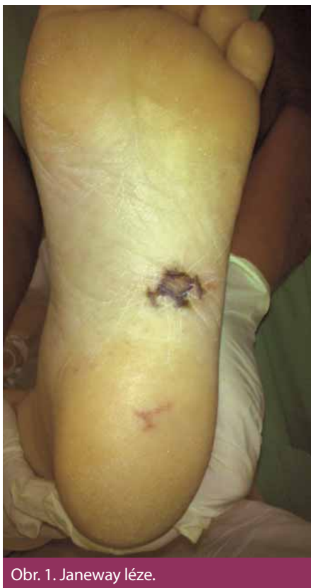
Obr. 1. Janeway léze.

Prvotními důvody kontaktu pacienta se zdravotní péčí jsou nespecifické příznaky, především horečka, dále pak ischemické projevy systémové embolizace (mozková příhoda, infarkt sleziny, ledviny, akutní mezenterální ischemie apod.) a infekční projevy systémové embolizace (periferní abscesy). U těchto projevů budí podezření na IE především jejich kombinace (horečka ve spojení s novým srdečním šelestem či periferními embolizacemi) nebo netypický charakter (nevysvětlitelné abscesy a jejich neobvyklá lokalizace). Bohužel, většinou až později v průběhu onemocnění bývají zachyceny specifičtější, ale poměrně vzácné příznaky. Spíše u akutních forem IE bývají přítomny Janewayovy léze (nebolestivé nepravidelné tmavé hemoragické makuly, nejčastěji lokalizované na dlaních, ploskách nohou či plantární ploše prstů, trvající dny až týdny). Ke kožním projevům při protražovaném průběhu IE patří i Oslerovy uzlíky (bolestivé růžové noduly, často s bledým centrem, vyskytující se na prstech rukou či prstcích nohou, výsev je prchavý, trvá hodiny až dny, častěji u „subakutně“ probíhajících endokarditid). Výskyt těchto projevů se odhaduje na asi 2–5 % případů, zatímco v předantibiotické éře se vyskytovaly ve 40–90 % [9]. Délétrvajících endokarditida vede k tvorbě imunokomplexů s následnou imu-