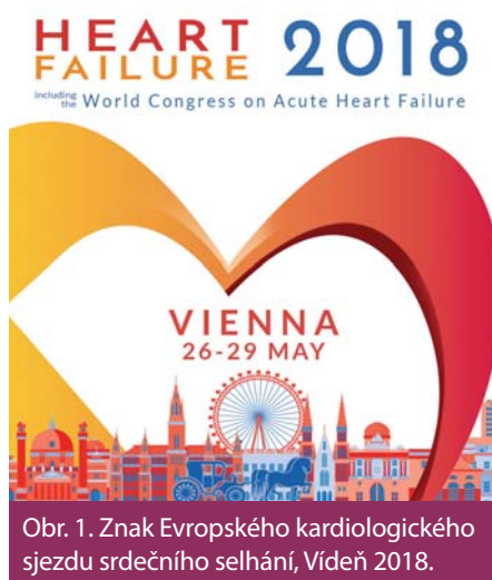
Obr. 1. Znak Evropského kardiologického sjezdu srdečního selhání, Vídeň 2018.

Sakubitril valsartan je znám především ze studie PARADIGM-HF, která prokázala jasný efekt na snížení mortality i morbidity u nemocných s CHSS. Prezentována byla na ESC