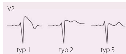
Obr. 1. EKG projevy Brugada syndromu, jediný „diagnostický“ je typ 1, tj. ST elevace \geq 2 mm následovaná negativní vlnou bez izoelektrické nebo s minimální izoelektrickou linií, zvaný také „Coved type“; další dva typy nazýváme „Saddle back“ – typ 2 má mít výše J bod než T vlnu, typ 3 naopak. Upraveno dle [21,22].

dominantní primárně elektrická porucha bez strukturálního srdečního onemocnění projevující se ST elevacemi, negativními T v pre-kordiálních svodech; postupně byly popsány tři typy dle povrchového EKG (obr. 1). Onemocnění se vyznačuje zvýšeným rizikem NSS na fibrilaci komor, obzvláště při teplotách nebo ve spánku [22]. EKG obraz se u jednotlivého pacienta může měnit, demaskovat typický EKG projev (typ I) lze pomocí ajmalinového testu, který ale není zcela bez rizika indukce maligní arytmie. Později byly u BrS popsány i strukturální změny, hlavně pravé komory. Tímto se otevřela diskuze o patofyziologii, rizikové stratifikaci, typu možné léčby, ale i úloze nejčastěji zmiňované „kauzální“ mutace (je známo již přes 100 mutací) genu SCN5A , který kóduje \alpha -podjednotku natriového kanálu [23]. Genetické testování je doporučeno u rodinných příslušníků pacienta s prokázanou kauzální mutací v genu SCN5A [16]. Léčebné možnosti BrS tkví v implantaci ICD – ze sekundární prevence u pacientů, kteří prodělali fibrilaci komor; z primární prevence u pacientů se spontánním BrS typem 1 na povrchovém EKG a synkopou. Z léků se používá chinidin, a to i v případě elektrické bouře [22]. Jako viabilní léčebná varianta u vybraných nemocných se prosazuje katetrizační ablace – modifikace epikardiálního substrátu ve výtokovém traktu