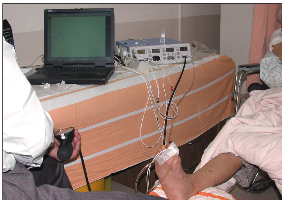
Obr. 2. Systém Periflux 5000 + sonda přiložená na palci PDK.

K systému PERIFLUX 5000 lze připojit velké množství sond, které najdou uplatnění v nejrozličnějších klinických aplikacích [8]: