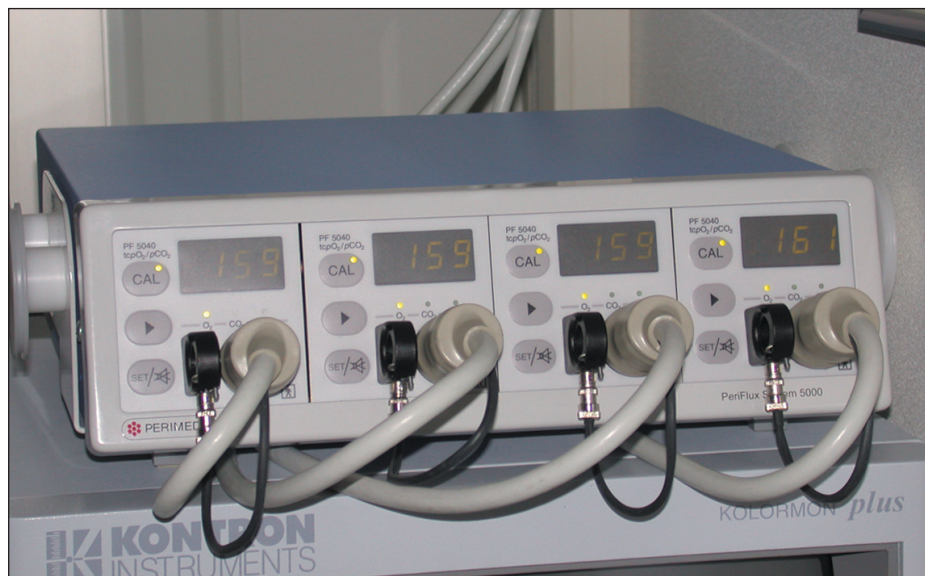
Obr. 1. Systém Periflux 5000.