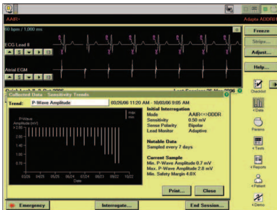
Obr. 4. Průběh měření síňového sensingu.

i hodnotu stimulačního prahu komorové elektrody. Měřicí algoritmus spočívá ve vyhodnocení přítomnosti tzv. stimulací evokované odpovědi při snižování stimulační energie. Předem nastaveno je měření v intervalu 24 hodin, a to 1 hodinu po půlnoci. Ošetřující lékař může zvolit jinou dobu měření, v případě potřeby může měřicí interval prodloužit prodloužit až na max. 7 dnů či zkrátit na minimum 1 hodiny. Je možné zvolit i jinou dobu měření. Hodnota stimulační energie je přednastavena na adaptivní s rezervou dvojnásobku napětí stimulu oproti napětí stimulu prahového.