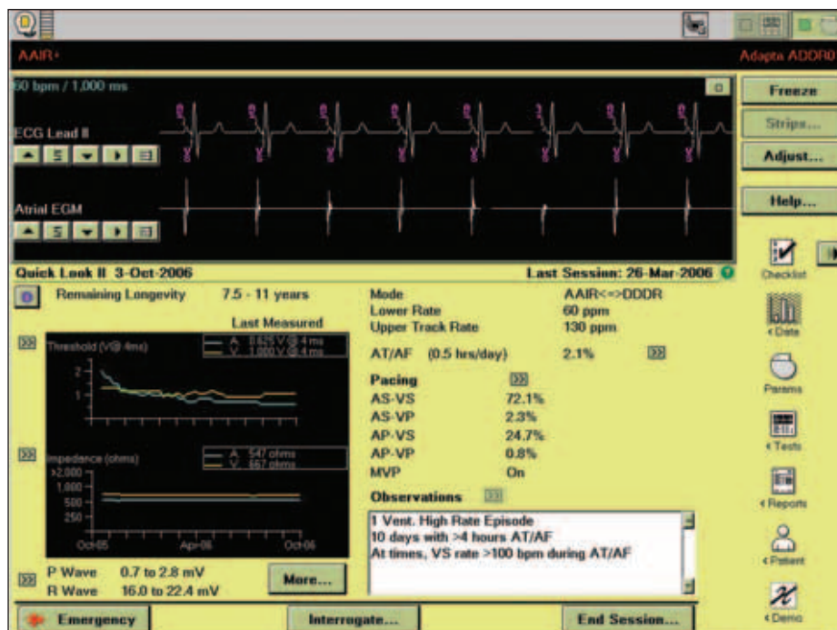
Obr. 1. Obrazovka Quick Look II.

Studie byla prováděna jako retrospektivní. Do studie byli zařazeni všichni nemocní, kterým byla na našem pracovišti provedena implantace přístroje Adapta ADDR01 (Medtronic, Minneapolis, MI, USA) v období od 1. 6. 2005