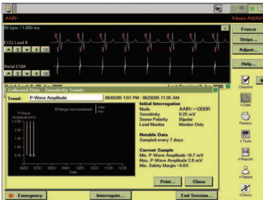
Obr. 6. Průběh měření síňového sensingu v situaci, kdy opakovaně není dodržen bezpečnostní limit algoritmu „sensing assurance“.

ven nebo vyšší než 80 %, a v takovém případě přístroj na této obrazovce hodnotu amplitudy neuvádí. V případě amplitudy komorového signálu byl tento údaj změřen v 18 případech a sledán vyhovujícím. V 2 dalších případech byl změřen, avšak vyžadoval další kontrolu – prvnímu číselnému údaji přecházelo znaménko „<“ a v 7 případech byl podíl stimulovaných cyklů alespoň 80 %. Ve všech případech byl ponechán režim „sensing assurance“.