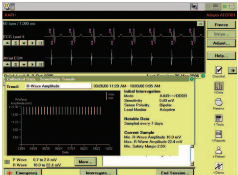
Obr. 5. Průběh měření komorového sensingu.

Amplituda intrakardiální vlny P byla změřena a byla shledána vyhovující v 9 případech. Ve 3 případech byla změřena, ale naměřené hodnoty si vyžádaly další analýzu – prvnímu číselnému údaji předcházelo znaménko „<“ a v 15 případech byl podíl stimulovaných cyklů ro-