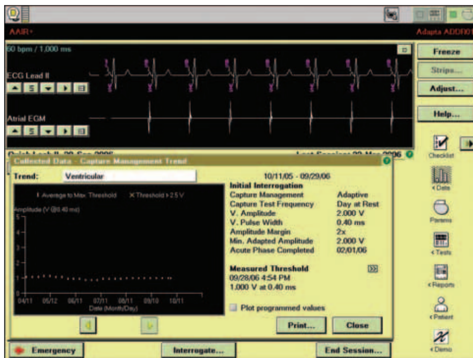
Obr. 3. Podrobnosti o průběhu automatického měření komorového prahu.