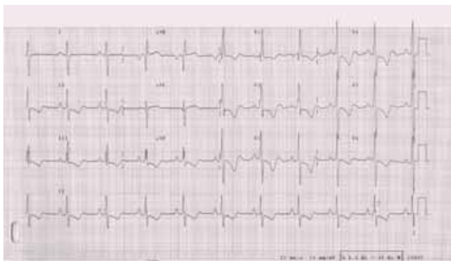
Obr. 2. EKG u nemocné s těžkou plicní arteriální hypertenzí: P pulmonale. R/S ve V1 > 1, inkompletní blokáda pravého raménka Tawarova, naznačené deprese ST a negativní T ve svodech II, III, aVF, V1-6.