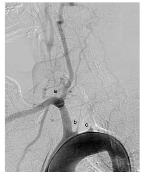
Obr. 3. Angiografický obrázek Takayasu arteritidy v chronickém stadiu s obliteracemi magistralních mozkových tepen. Mozek je zásobován jedinou mohutnou vertebrální tepnou. a – obliterace pravé společné karotidy, b – obliterace levé společné karotidy, c – obliterace levostranné podklíčkové tepny.

Léčba chronické periaortitidy a retroperitoneální fibrózy závisí na stupni renální insuficience. V případech pokročilého renálního selhání je indikováno včasné odstranění obstrukce močovýchodů a to buď retrogradní katetrizací ureterů, nebo perkutánní nefrostomií. Následuje operační řešení spočívající v uvolnění močovýchodů z okolního vaziva. Postoperačně je doporučována léčba kortikoidy k zabránění progresu onemocnění. V případě absence významnější renální insuficience doporučuje řada autorů primárně postupovat konzervativně a nemocné léčit kortikoidy. Ty vedou k ústupu systémových příznaků i ústupu uretrální obstrukce [23].