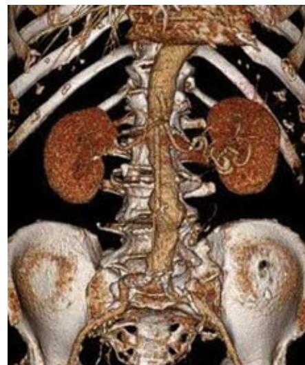
Obr. 1. 3D CT rekonstrukce obrazu aneuryzmatu břišní aorty s max. průměrem 49 mm.

Stěna aorty je tvořena nejenom buněčnými strukturami (např. buňky hladkých svalů), ale podstatnou část tvoří i matrixové proteiny (elastin a kolagen). Změny ve struktuře a poměrech uvedených proteinů pravděpodobně hrají velmi důležitou roli v patogenezi AAA. Víme, že obsah elastinu, který je především odpovědný za „pružnost“ aortální stěny, klesá od proximálních hrudních partií aorty k distálním infrarenálním úsekům. Největší pokles v obsahu elastinu je pozorován právě na přechodu aorty do infrarenálních partií, kde také dochází ke změně v poměrech mezi elastinem a kolagenem. Sám kolagen tvoří jakousi pevnou síť ve stěně aorty, která ochraňuje stěnu aorty před rupturou. Lze tedy velmi zjednodušeně shrnout, že změny v kvalitě či kvantitě elastinu ve stěně aorty spolupůsobí při formování vaku výdutě, změny v kvalitě či kvantitě kolagenu potom ovlivňují riziko ruptury vaku výdutě [19]. Na změnách ve struktuře aortální stěny u nemocných s AAA se pravděpodobně podílí zvýšená aktivita matrixových proteolytických enzymů, zejména metaloproteináz (MMP-9). V literatuře najdeme některé práce, jež prokazují až 3krát zvýšenou aktivitu MMP-9 ve stěně aorty u nemocných s AAA [20–23]. Histologické vyšetření stěny aorty u nemocných s AAA prokazují rovněž zánětlivou infiltraci zejména ve vrstvách medie a adventicie, u „klasického“ aterosklerotického postižení aortální stěny je tato zánětlivá infiltrace lokalizována v intimě [24]. Role zánětlivého procesu v patogenezi vývoje AAA zů-