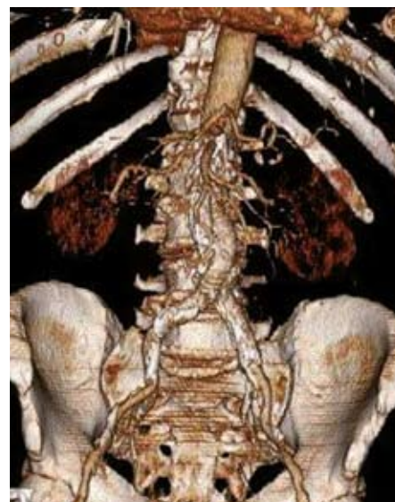
Obr. 3. 3D CT rekonstrukce obrazu aneuryzmatu břišní aorty po implantaci břišního stentgraftu.