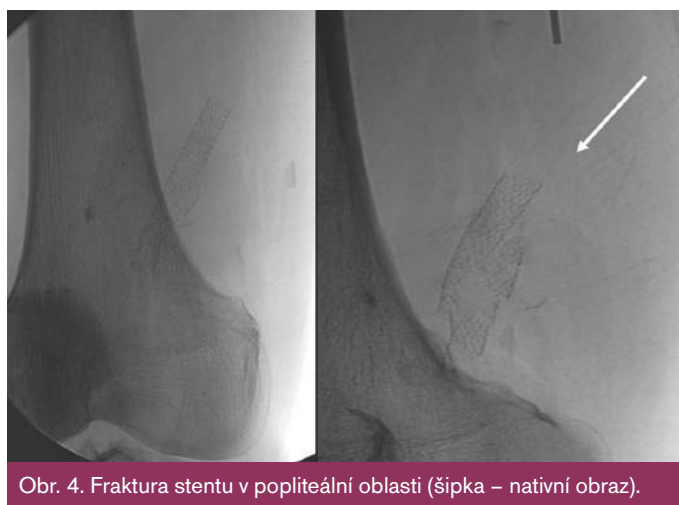
Obr. 4. Fraktura stentu v popliteální oblasti (šipka – nativní obraz).

škození stentu ve femoropopliteálním segmentu dochází kvůli působení velkých dynamických sil (axiální komprese a cyklická flexe) v této oblasti během flexe kolena [8–10]. Fraktura stentu vedla v tomto případě k reokluzi cévní rekonstrukce, která byla opět vyřešena endovaskulárně. Podle zavedené praxe implantace stentu do protetického bypassu není doporučena a rutinně se neprovádí. Pokud je chirurgická léčba proveditelná, je vždy preferovaná. Implantace stentu v této oblasti musí být rezervována pouze pro případy, kdy je chirurgické řešení vysoce rizikové a končetina akutně ohrožena.