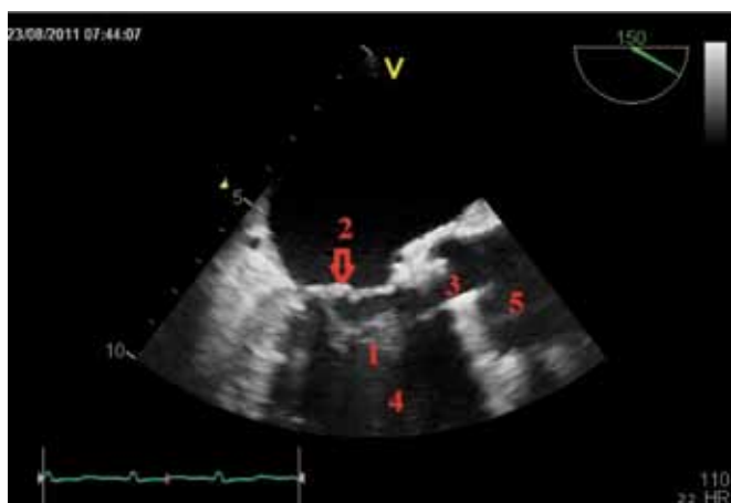
Obr. 3. Transesophageální echokardiografie. Echogenní útvar vycházející z mitrální chlopně vylající do LVOT. 1 – akcesorní závěsný aparát mitrální chlopně, 2 – mitrální chlopně, 3 – otevřená umělá aortální chlopně, 4 – levá komora, 5 – aorta

V případě náhle vzniklé aortální regurgitace manifestující se akutním srdečním selháním u pacienta po mechanické chlopní náhradě je třeba myslet v první řadě na mechanickou dysfunkci chlopní náhrady způsobenou nejčastěji infekční endokarditidou či trombotickou okluzí, zvláště při neúčinné antikoagulační terapii. Jako další příčina přichází v úvahu přerůstající panus či méně často srdeční nádor. Velice vzácnou příčinou může být i akcesorní závěsný aparát mitrální chlopně, jako tomu bylo i v případě našeho pacienta. Toto raritní kongenitální onemocnění se často manifestuje symptomy způsobenými obstrukcí výtokového traktu [1], výjimečně pak těžkou aortální regurgitací [2]. Ve většině případů se symptomy objeví již v první dekádě života