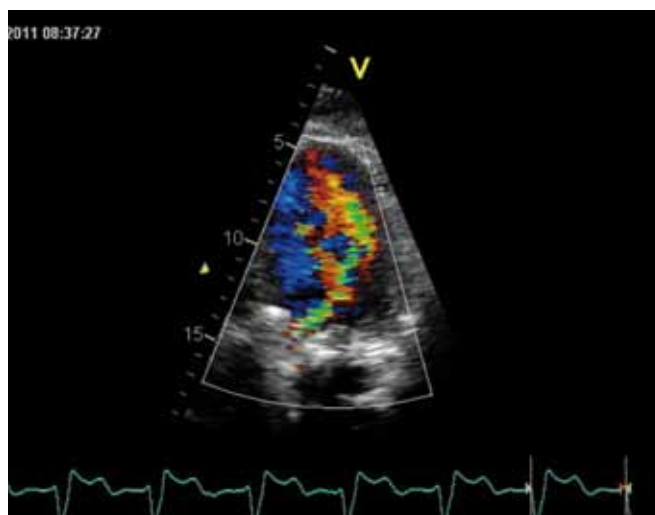
Obr. 2. Transtorakální echokardiografie. Významná aortální regurgitace z apikální čtyřdutinové projekce s aortou – CFM zobrazení.

selhání. Pacient byl zaléčen kontinuálním parenterálním podáním isoketu a i.v. bolusy kličkových diuretik s výrazným ústupem dušnosti a bolestmi na hrudi. Dále byla podána p.o. antibiotická terapie z důvodu rozvoje respiračního infektu. Druhý den hospitalizace byl již pacient kardiopulmonálně kompenzován, při ranní vizitě byl však zjištěn intermitentní diastolický šelest s maximem v Erbově bodě spojený s vymizením arteficiálního zvuku mechanické chlopně. Bylo provedeno opětovné transtorakální echokardiografické vyšetření s nálezem intermitentní hemodynamicky významné aortální regurgitace (obr. 1, 2). Pro podezření na mechanickou dysfunkci aortální protězy bylo doplněno jícnové echokardiografické vyšetření, při kterém byla zjištěna nevýznamná, technická, aortální regurgitace. V oblasti před-