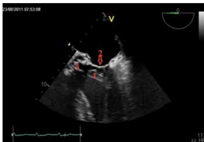
Obr. 4. Transesophageální echokardiografie. Echogenní útvar vycházející z oblasti mitrální chlopně vylající do LVOT. 1 – akcesorní závěsný aparát mitrální chlopně, 2 – mitrální chlopně, 3 – otevřená umělá aortální chlopně