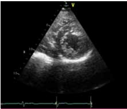
Obr. 1. Echokardiografický obraz nekompaktní kardiomyopatie – parasternální krátká osa na konci systoly, poměr nekompaktní ke kompaktní vrstvě je > 2.