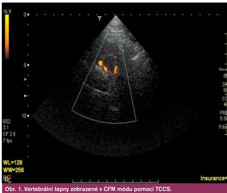
Obr. 1. Vertebrální tepny zobrazené v CFM módu pomocí TCCS.

Farmakologická léčba se opírá o dva základní pilíře, léčbu antitrombotickou a farmakologickou (vedle obvyklých režimových opatření) kontrolu RF aterosklerózy.