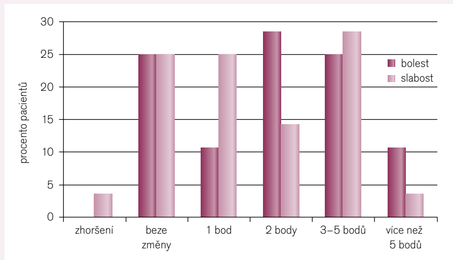
Graf 2. Změny subjektivních pocitů mezi prvním a posledním vyšetřením.

Young et al [12] publikovali dvojité slepou, placebem kontrolovanou studii, v níž k 10–40 mg simvastatinu podávali u 44 pacientů 200 mg KQ10/den. Ačkoli pozorovali zvýšené plazmatické hladiny KQ10, nezaznamenali subjektivní statisticky významné rozdíly mezi placebovou a léčenou větví. KQ10 podávali pouze 12 týdnů, což může být krátká doba k projevení se plného efektu. Oproti tomu Caso et al [13] podávali 32 pacientům s hypercholesterolemií a statinovou myopatií 100 mg KQ10 oproti 400 IU vitamínu E. Ve větvi léčené KQ10 došlo k poklesu bolestivosti svalů o 38 %, kdežto ve větvi léčené vitamínem E nebyl pozorován rozdíl. Konečně Mabuchi et al [14] podávali KQ10 pacientům léčeným 10 mg atorvastatinu s elevací CK,