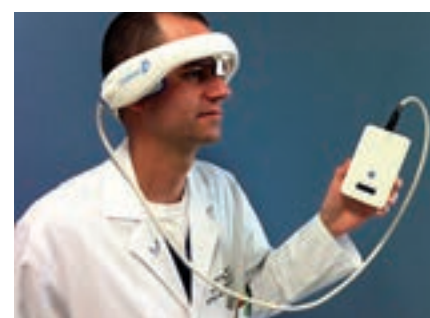
Obr. 6. CLOTBUST-ER (Cerevast Therapeutics).

ných sonografistů. Jednou z možností, jak sonotrombolýzu uvést do běžné praxe, je vytvoření automatických přístrojů, které nevyžadují přítomnost zkušeného operátora. Pilotní studií s přístrojem CLOTBUST-ER firmy Cerevast (obr. 6) byla studie CLOTBUST-HF . Do studie bylo zařazeno 20 pacientů s proximální intrakraniální okluzí (70 % ACM, medián NIHSS 15). Všichni pacienti tolerovali dvouhodinovou insonaci přístrojem a u žádného nedošlo k rozvoji IC krvácení. Po 2 hod bylo plné rekanalizace dosaženo u osmi pacientů (40 %) a u dvou pacientů (10 %) došlo k rekanalizaci parciální. Tyto výsledky jsou velmi povzbudivé, je dosaženo minimálně dvojnásobné rekanalizace oproti sa-