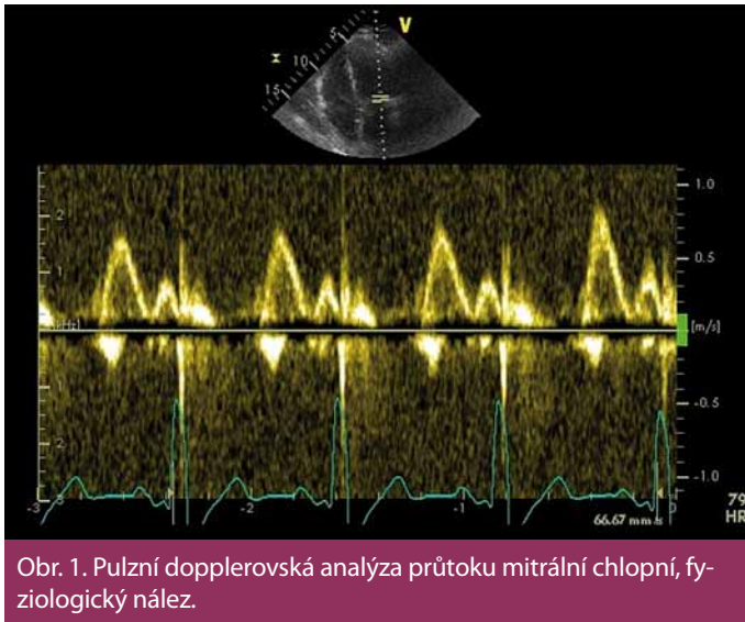
Obr. 1. Pulzní dopplerovská analýza průtoku mitrální chlopní, fyziologický nález.