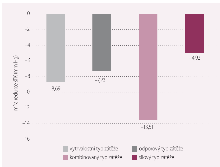
Graf 2. Vliv jednotlivých typů zátěže na pokles hodnot TK (mm Hg). sTK – systolický krevní tlak